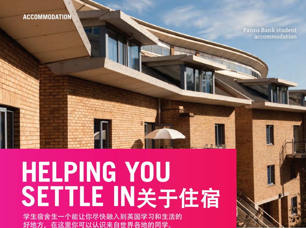
Panns Bank student accommodation