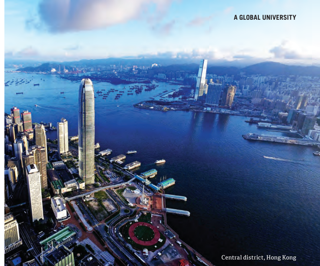
Central district, Hong Kong

作为一名桑德兰的国际学生，你会体验到国际化的社交。我们是英国国际留学生人数最多的学校之一，你将和来自100多个不同国家的同学们一起学习和生活。近几十年来，我们在不断提高教学质量的同时，也在全球建立了众多的良好合作关系。国际性的视野将开阔你的眼界，同时你也会从国际友人的身上获得更过的生活和学习经验。