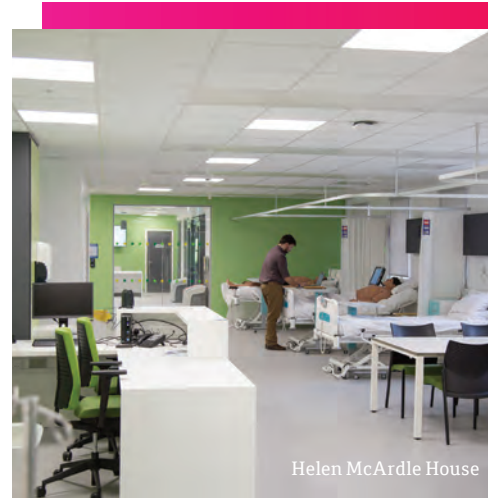
Helen McArdle House