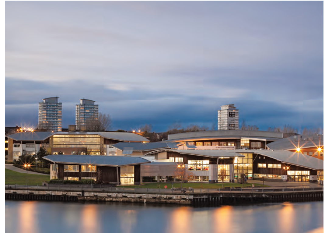
The Sir Tom Cowie Campus at St Peter's