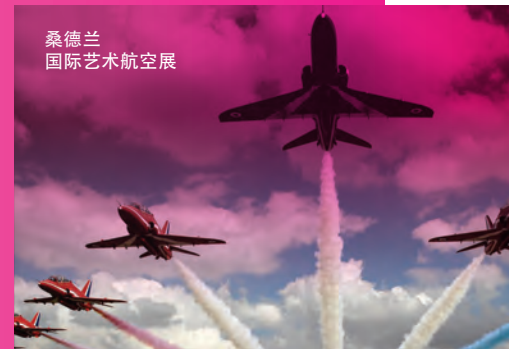
桑德兰 国际艺术航空展

此外，桑德兰市议会、桑德兰大学和音乐、艺术和文化信托基金之间建立了一个令人兴奋的新伙伴关系，名为桑德兰文化。