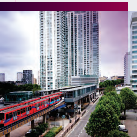
South Quay DLR station | 距离学校仅需步行2分钟

这里有著名的伦敦地铁和地面服务设施，包括DLR，加上许多公共汽车路线，自行车路线和公共人行道。